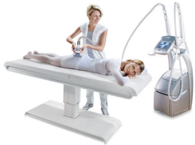
nach einer Behandlung